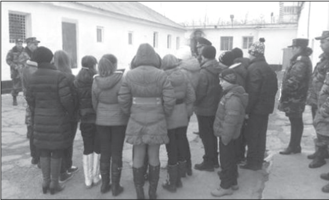
de viață din penitenciar, condițiile de detenție, activitățile de educație și asistență

În cadrul vizitei, elevii s-au familiarizat cu modul