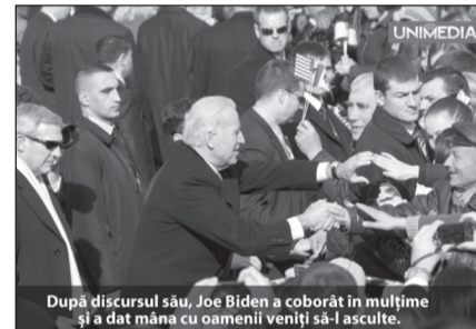
După discursul său, Joe Biden a coborât în mulțime și a dat mîna cu oamenii veniți să-l asculte.

Înaltul oaspete și-a încheiat cuvîntarea ținută în fața publicului numeros adunat în Scuarul Teatrului Național de Operă și Balet în stil american: „Dumnezeu să binecuvînteze America și Dumnezeu să binecuvînteze Moldova”.