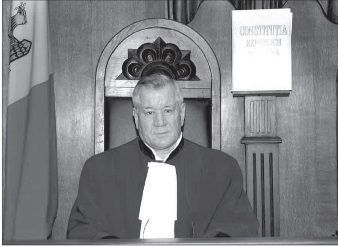
Victor PUȘCAȘ, judecător al Curții Constituționale, doctor în drept, conferențiar universitar

(Comentariu la hotărârile Curții Constituționale nr.10 din 16.04.2010 și nr. 11 din 27.04.2010)