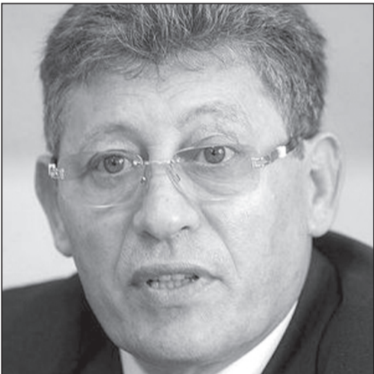
Interlocutorii au abordat subiectul implementării unui

Moldova și Belarus sînt cointeresate să dezvolte relații de colaborare constructive și reciproc avantajoase pe diverse planuri. Despre aceasta s-a discutat în timpul unei întâlniri dintre președintele interimar Mihai Ghimpu și președintele Consiliului Republicii al Adunării Naționale a Republicii Belarus Anatol Rubinov în cadrul Conferinței Mondiale a Președinților de Parlament, care a avut loc la Geneva.