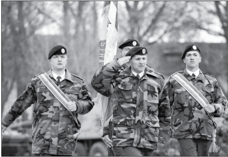
În același timp, peste un sfert din respondenți au răspuns că nu prea au încredere, iar circa 20 la sută - că nu au

O încredere relativă în Armată au exprimat 36,3% dintre moldovenii care au participat la sondaj, iar circa șase la sută au spus că au mare încredere. Dintre aceștia, majoritatea o reprezintă femeile și persoanele de ambele genuri cu vârsta cuprinsă între 18 și 29 de