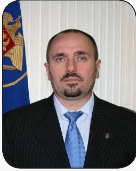
Valeriu ZUBCO, Procurorul General