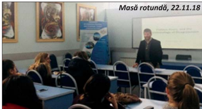
Masă rotundă, 22.11.18

experiențe acumulate, încurajând noi parteneriate și colaborări.