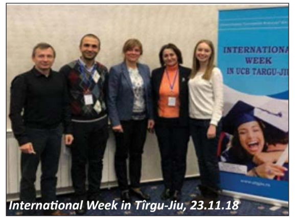
International Week in Tîrgu-Jiu, 23.11.18

Participanții, profesorii și studenții de la USPEE și AUM, au ascultat cu deosebit interes opiniile științifice noi privind problemele de politică