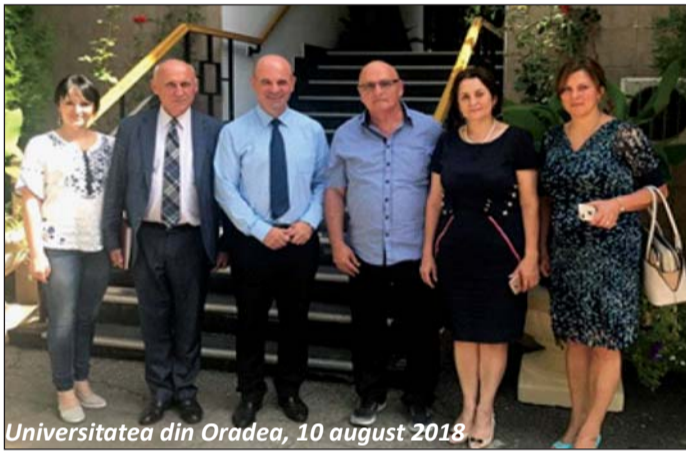
Universitatea din Oradea, 10 august 2018

„Democrația și tranziția”, „Ce înseamnă acordul de asociere RM-UE?”, „Realități socio-politice în RM” etc. Printre cei mai activi au fost