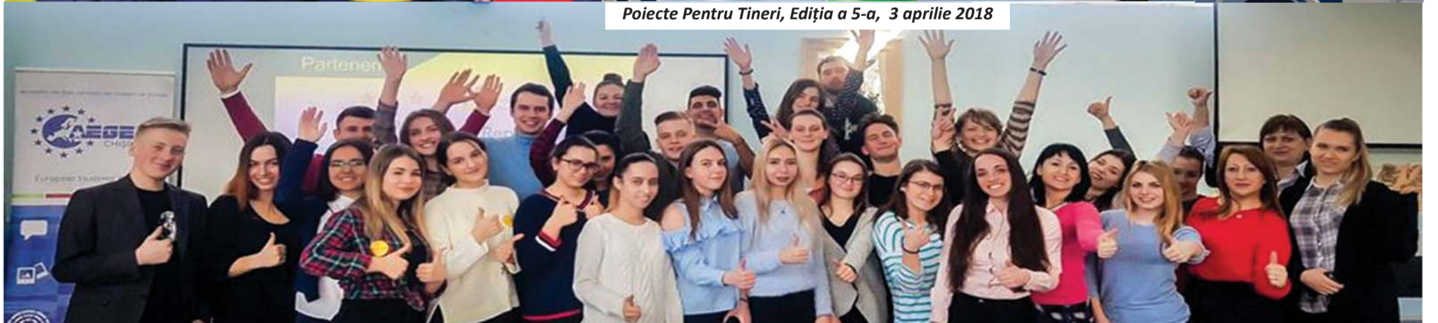
Poiecte Pentru Tineri, Ediția a 5-a, 3 aprilie 2018