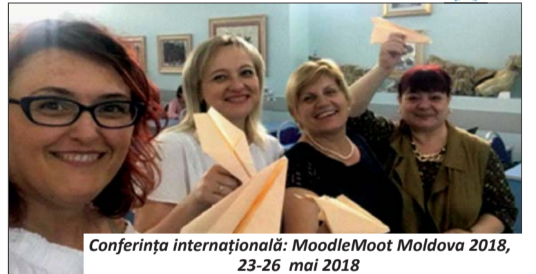
Conferința internațională: MoodleMoot Moldova 2018, 23-26 mai 2018